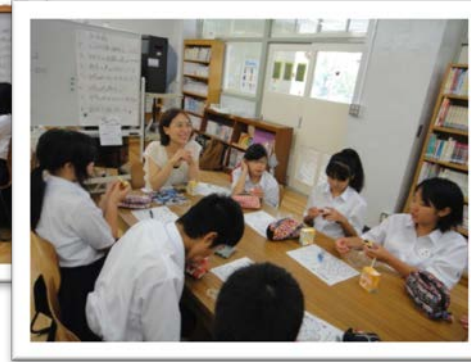
←第1部の後半はゲストを囲んで 話を聞いたり質問したりします