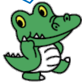
大阪大学 公式マスコットキャラクター 「ワニ博士」