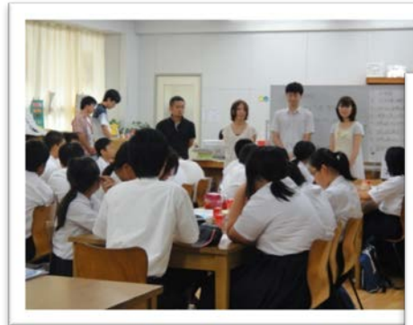
←第1部の前半はゲストが色々な質問に回答するコーナー

大学の先生、社会人、大学生の計6人の先輩たちが自分たちの“理系ライフ”について語ってくれます。 中学の時はどうだった? その進路を選んだ理由は? 実際行ってみてどんな感じ? 毎日なにしているの? それって おもしろい? なんでもありの質問タイムもたっぷり。おたのしみに!